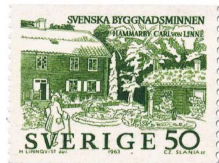
Das Landgut Linnés bei Uppsala: Das Postmuseum in Stockholm zeigt derzeit das Leben des großen Botanikers als beliebtes Briefmarkenmotiv.

Linné errichtete neben der Gattung weitere willkürliche Stufen in der Hierarchie der Klassifikation wie Familie, Ordnung, Klasse, Stamm und Reich. So entstand durch ihn ein verschachteltes hierarchisches System, was zur menschlichen Eigenschaft, in Kategorien zu denken, passt. Linné teilte neben der belebten auch die unbelebte Natur in drei „Naturreiche“ ein: Mineralien (Regnum lapideum), Pflanzen