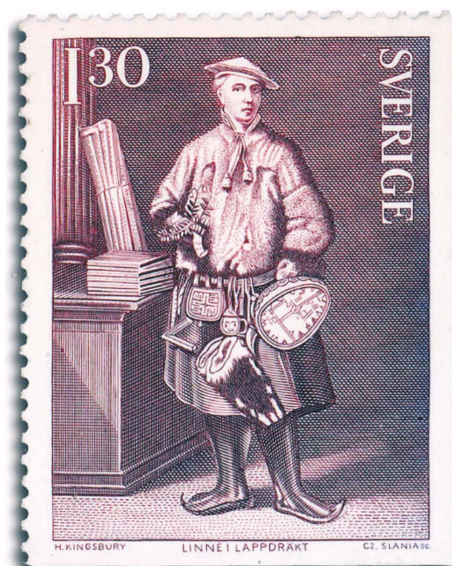
Linné (1707-1778) mit Lappen-Kostüm, Sami-Trommel und Linnaea borealis im Arm

Nach der Entdeckung der fundamentalen Unterschiede zwischen Organismen mit Zellkern (Eukaryonten) und ohne einen solchen (Prokaryonten) wurde die Do-